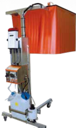
Table de tri adaptée MAFEX®